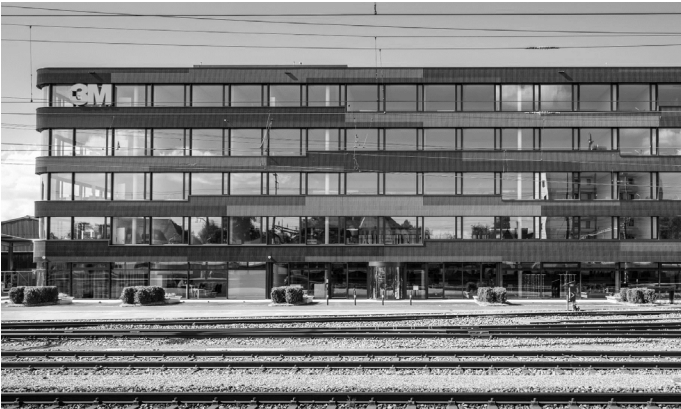
Kühlhausstrasse 2, 4900 Langenthal (BE)

Allokationen erfolgen in Bestandsliegenschaften mit nachhaltigen Ertragsperspektiven sowie in Bestandsliegenschaften mit Entwicklungspotenzial (Modernisierung, Verdichtung, Umnutzung). Zusätzlich beinhaltet das Portfolio Investitionen in Neubau- und Entwicklungsprojekte.