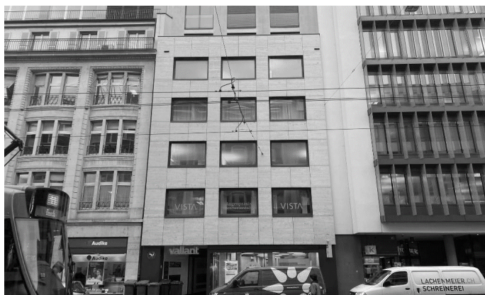
Aeschenvorstadt 37, 4051 Basel (BS)

Les placements sont effectués dans des immeubles existants présentant des perspectives de rendement durable ou un potentiel de développement (modernisation, densification, changement d'affectation). Le portefeuille est également constitué de placements effectués dans des projets de construction et de développement.