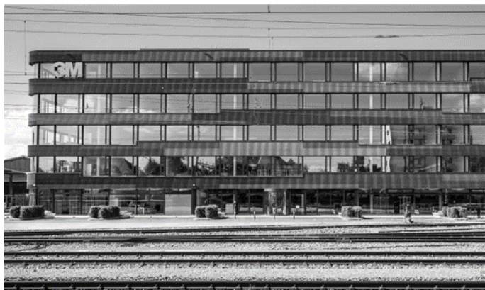
Kühlhausstrasse 2, 4900 Langenthal (BE)

Les placements sont effectués dans des immeubles existants présentant des perspectives de rendement durable ou un potentiel de développement (modernisation, densification, changement d'affectation). Le portefeuille est également constitué de placements effectués dans des projets de construction et de développement.