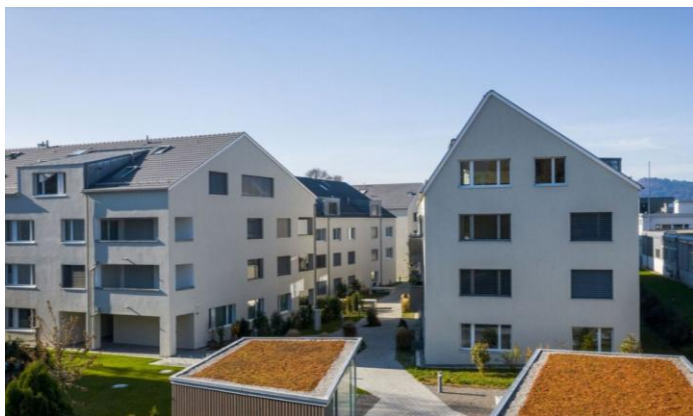
Immeuble résidentiel Bahnhofsstrasse 30-36, 5615 Fahrwangen (AG)

Les placements sont effectués dans des immeubles existants présentant des perspectives de rendement durable ou un potentiel de développement (modernisation, densification, changement d'affectation). Le portefeuille est également constitué de placements effectués dans des projets de construction et de développement.