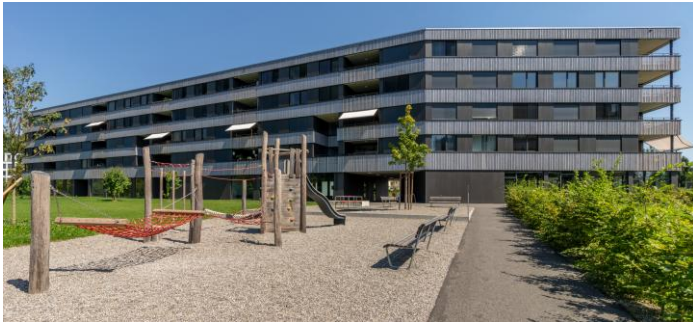
Immeuble résidentiel Strickereistrasse 2a-c, Aarburg (AG)

Les placements sont effectués dans des immeubles existants présentant des perspectives de rendement durable ou un potentiel de développement (modernisation, densification, changement d'affectation). Le portefeuille est également constitué de placements effectués dans des projets de construction et de développement.