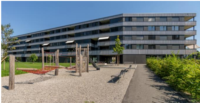
Wohnliegenschaft Strickereistrasse 2a-c, Aarburg (AG)

Allokationen erfolgen in Bestandsliegenschaften mit nachhaltigen Ertragsperspektiven sowie in Bestandsliegenschaften mit Entwicklungspotenzial (Modernisierung, Verdichtung, Umnutzung). Zusätzlich beinhaltet das Portfolio Investitionen in Neubau- und Entwicklungsprojekte.