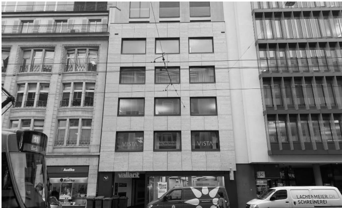
Aeschenvorstadt 37, 4051 Basel (BS)

Allokationen erfolgen in Bestandsliegenschaften mit nachhaltigen Ertragsperspektiven sowie in Bestandsliegenschaften mit Entwicklungspotenzial (Modernisierung, Verdichtung, Umnutzung). Zusätzlich beinhaltet das Portfolio Investitionen in Neubau- und Entwicklungsprojekte.