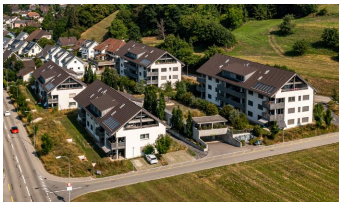
Immeuble résidentiel Wohnliegenschaft Müliggässli, 5723 Teufenthal (AG)

Les placements sont effectués dans des immeubles existants présentant des perspectives de rendement durable ou un potentiel de développement (modernisation, densification, changement d'affectation). Le portefeuille est également constitué de placements effectués dans des projets de construction et de développement.