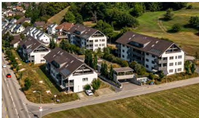
Immeuble résidentiel situé au Müligässli, 5723 Teufenthal (AG)

Les placements sont effectués dans des immeubles existants présentant des perspectives de rendement durable ou un potentiel de développement (modernisation, densification, changement d'affectation). Le portefeuille est également constitué de placements effectués dans des projets de construction et de développement.