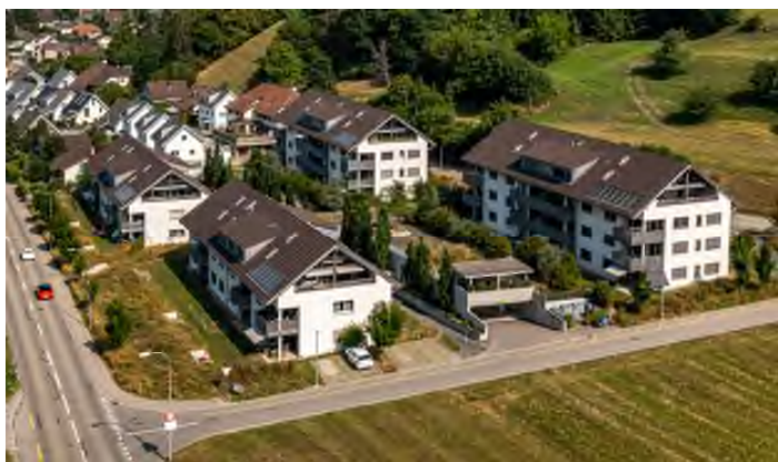
Wohnliegenschaft am Müliggässli, 5723 Teufenthal (AG)

Allokationen erfolgen in Bestandsliegenschaften mit nachhaltigen Ertragsperspektiven sowie in Bestandsliegenschaften mit Entwicklungspotenzial (Modernisierung, Verdichtung, Umnutzung). Zusätzlich beinhaltet das Portfolio Investitionen in Neubau- und Entwicklungsprojekte.