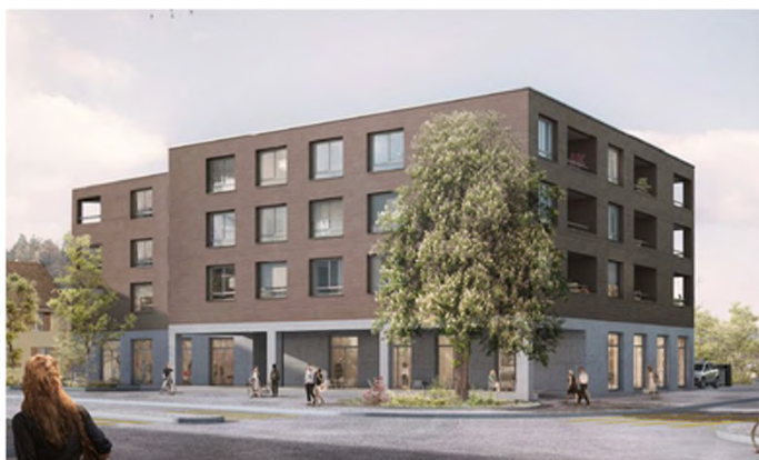
Développement Hauptstrasse 19, 5502 Hunzenschwil (AG)

Les placements sont effectués dans des immeubles existants présentant des perspectives de rendement durable ou un potentiel de développement (modernisation, densification, changement d'affectation). Le portefeuille est également constitué de placements effectués dans des projets de construction et de développement.