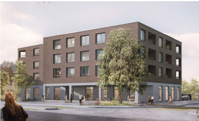
Entwicklung Hauptstrasse 19, 5502 Hunzenschwil (AG)

Allokationen erfolgen in Bestandsliegenschaften mit nachhaltigen Ertragsperspektiven sowie in Bestandsliegenschaften mit Entwicklungspotenzial (Modernisierung, Verdichtung, Umnutzung). Zusätzlich beinhaltet das Portfolio Investitionen in Neubau- und Entwicklungsprojekte.